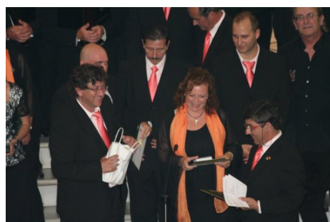
III Encuentro Coral “Andrés del Río Abaurrea” Ceuta